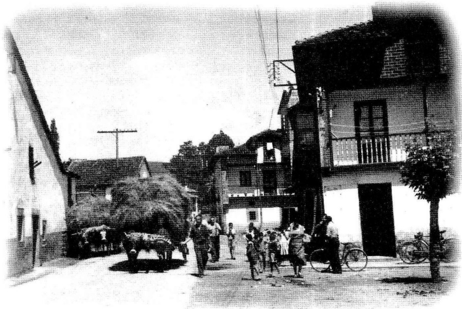
El barrio de la Pesa.

De Cantabria fueron don José de Escandón, que pobló y llenó de misiones la Tamaulipas de hoy, el Nuevo Santander de ayer: don José de la Puente y Peña, marqués de Villa Puente, siempre recordado con gratitud; fray Francisco Vélez Escalante, que llevó el pregón de Cristo más allá del río Colorado; don Antonio de Obregón y Alcocer, conde de la Valenciana, que dio nombre en Guanajuato a la mina de oro y plata más rica del mundo y aún deslumbrante iglesia barroca... Allí, precisamente en el Guanajuato erigido en Atenas Cervantina de América, está la sede de nuestra ofrenda de gratitud a México: el Museo iconográfico del Quijote.