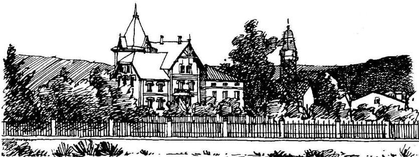
La finca de «San Diego», desde la vieja Avenida.

Si siempre Cantabria se ha sumado con entusiasmo y profundidad al servicio de los valores que, vividos en la sociedad, dan a ésta coherencia y vitalidad, no es ahora cuando va a necesitar de incitaciones para entregarse al servicio de la libertad, la justicia y la solidaridad. Desde los albores de la historia, cuando esta España empieza a forjarse, cuando el talante hispánico encuentra su originaria forja en las tierras que baña el mar de Cantabria, los cántabros han estado bien presentes en las tareas nobles de la libertad, la justicia y la solidaridad. Contribuimos a la realidad de esta España extendiéndose nuestros hombres y nuestra labor integradora; estuvimos presentes en la llegada a la historia de una comunidad desde el instante del nacimiento de España. La españolidad y aún la universalidad de los que tienen —tenemos— por solar esta tierra es patente garantía de nuestra entrega a las inquietudes y a los destinos que la historia ahora nos ofrece.