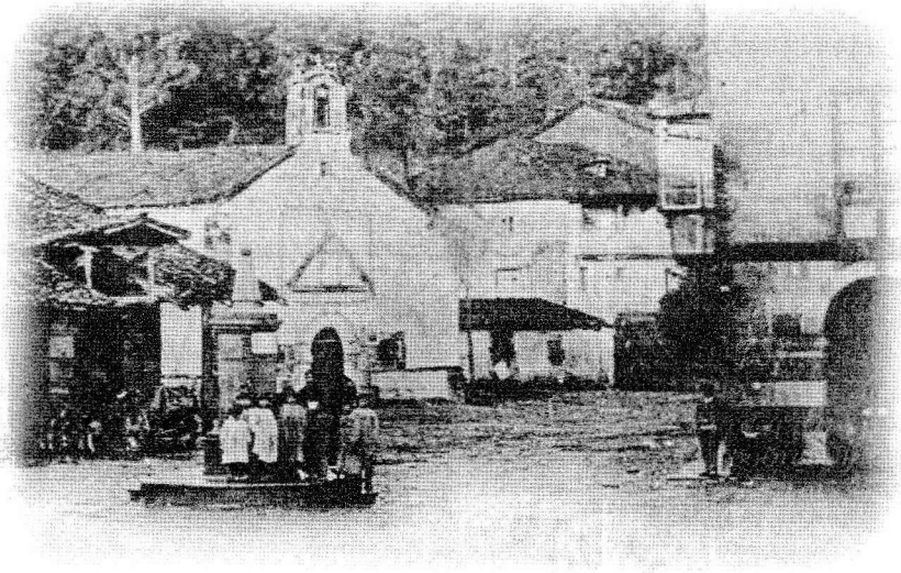
Capilla de la Virgen del Campo (1895).

y oral reunir merecidísimos adjetivos de entusiasta adhesión a las costumbres, los mitos, la ruta histórica y literaria de las brillantes páginas que ha escrito Cantabria en la historia de España? Basta una mera enumeración de nombres para que la sensibilidad, no sólo de quienes sois de esta tierra, sino de todos los demás españoles, vibre ante el retablo preclaro de hidalgos majestuosos, o la alegría curiosa de clásicos tipos populares, inmortalizados por la tradición popular y por las plumas de vuestros grandes Pereda, Concha Espina, Manuel Llano... No he querido exagerar en la utilización de reso-