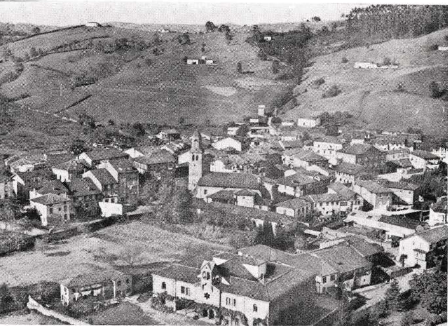
Vista general de Cabezón