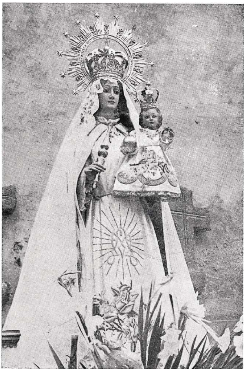
Ntra. Sra. la Virgen del Campo