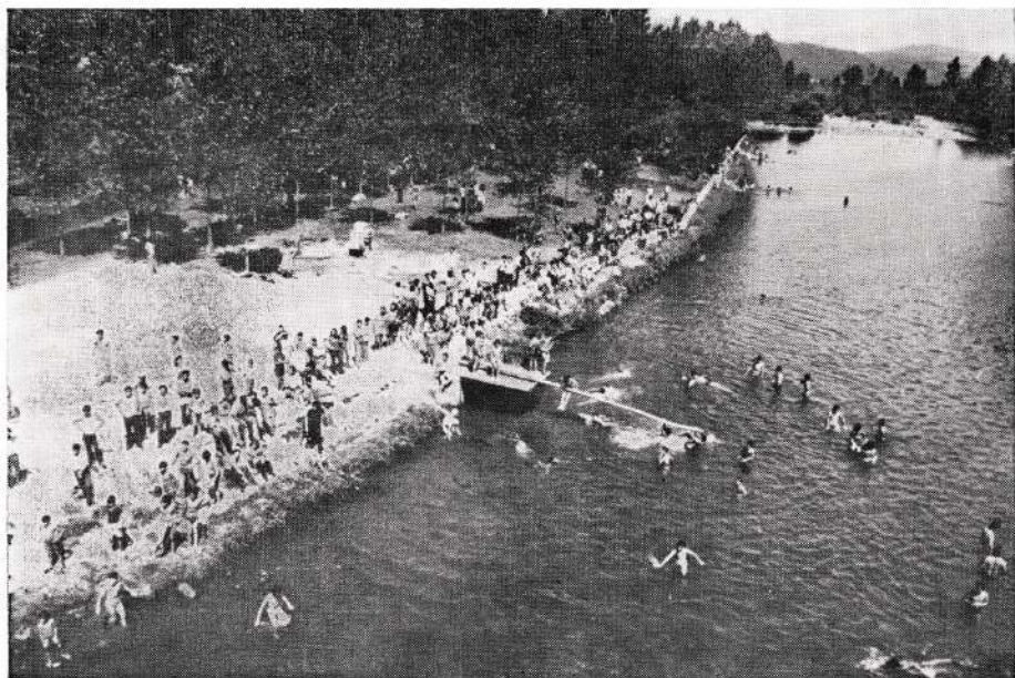
Campa de Santa Lucía

La Comisión Municipal de Festejos se reserva el derecho de alterar este programa si lo estima conveniente.